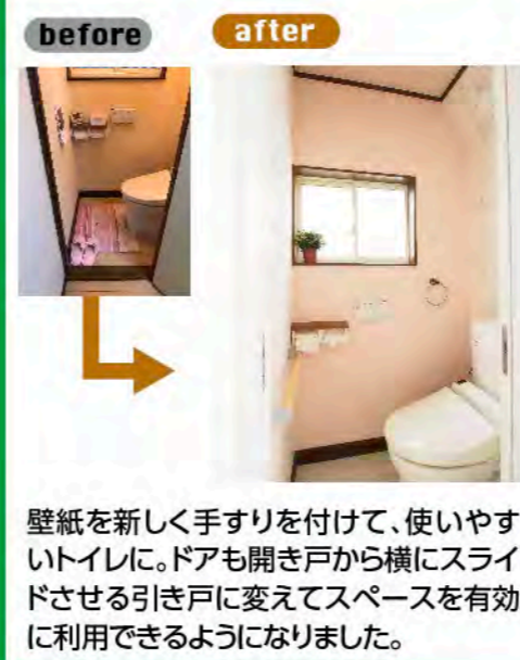
壁紙を新しく手すりを付けて、使いやすいトイレに。ドアも開き戸から横にスライドさせる引き戸に変えてスペースを有効に利用できるようになりました。