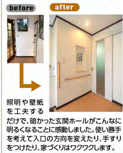
照明や壁紙を工夫するだけで、暗かった玄関ホールがこんなに明るくなることに感動しました。使い勝手を考えて入口の方向を変えたり、手すりをつけたり、家づくりはワクワクします。