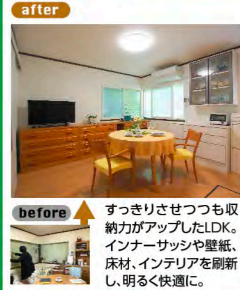
すっきりさせつつも収納力がアップしたLDK。インナーサッシや壁紙、床材、インテリアを刷新し、明るく快適に。