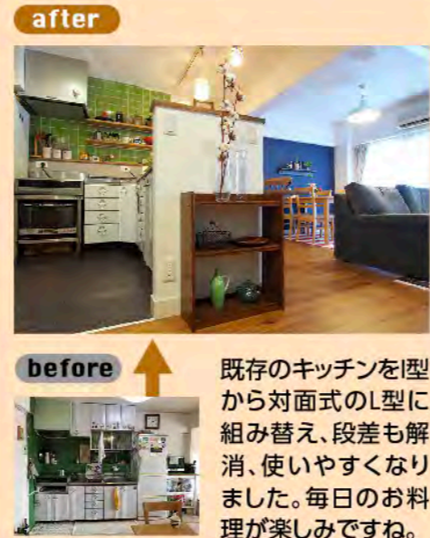
既存のキッチンを型から対面式のL型に組み替え、段差も解消、使いやすくなりました。毎日のお料理が楽しみですね。