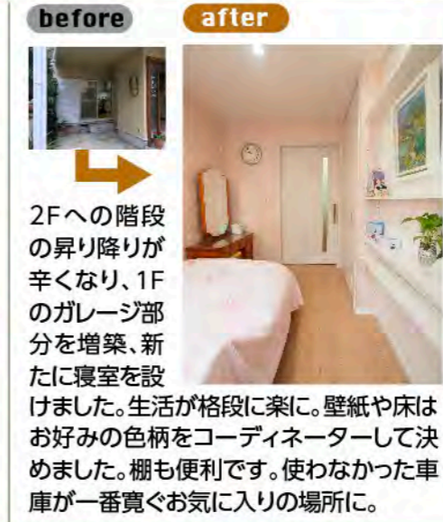
2Fへの階段の昇り降りが辛くなり、1Fのガレージ部分を増築、新たに寝室を設けました。生活が格段に楽に。壁紙や床はお好みの色柄をコーディネーターして決めました。棚も便利です。使わなかった車庫が一番寛ぐお気に入りの場所に。