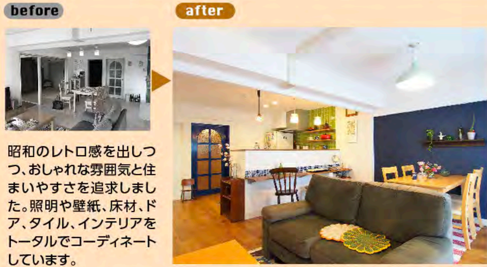
昭和のレトロ感を出しつつ、おしゃれな雰囲気と住まいやすさを追求しました。照明や壁紙、床材、ドア、タイル、インテリアをトータルでコーディネートしています。お好みの素材に囲まれて、K様の毎日の憩いのスペースが、より楽しく寛いだものになればと思います。