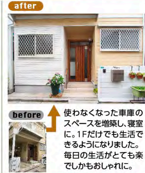
使わなくなった車庫のスペースを増築し、寝室に。1Fだけでも生活できるようになりました。毎日の生活がとても楽しくてもおしゃれに。