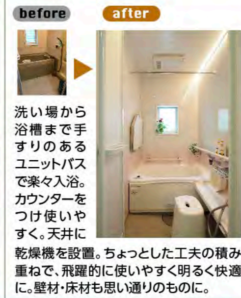
洗い場から浴槽まで手すりのあるユニットバスで楽々入浴。カウンターをつけ使いやすく。天井に乾燥機を設置。ちょっとした工夫の積み重ねで、飛躍的に使いやすく明るく快適に。壁材・床材も思い通りのものに。