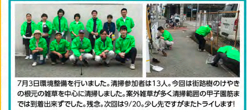
7月3日環境整備を行いました。清掃参加者は13人。今回は街路樹のけやきの根元の雑草を中心に清掃しました。案外雑草が多く清掃範囲の甲子園筋までは到着出来ずでした。残念。次回は9/20。少し先ですがまたトライします!