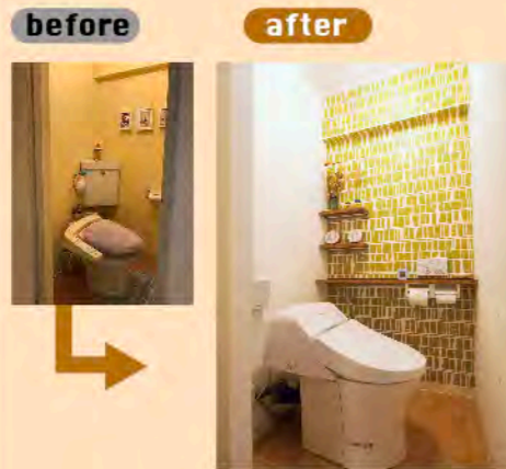
タンクレストイレにリフォームすることで、ゆったりとした空間を確保。奥壁をタイル風の壁紙にし、棚を作ることで機能性と楽しさが備わりました。毎日使うトイレだからこそこだわりたいですね。