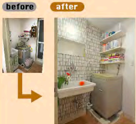
屈むのが大変でデッドスペースになりやすかった洗面の開き戸。棚をつくり取り出しやすくすると同時に、少し手狭だった足元の空間を広げました。壁紙や床材もお好みのものので楽しく使いやすい洗面に。